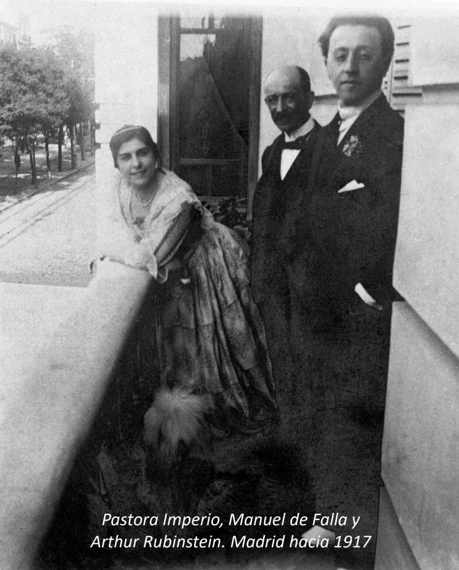
Pastora Imperio, Manuel de Falla y Arthur Rubinstein. Madrid hacia 1917