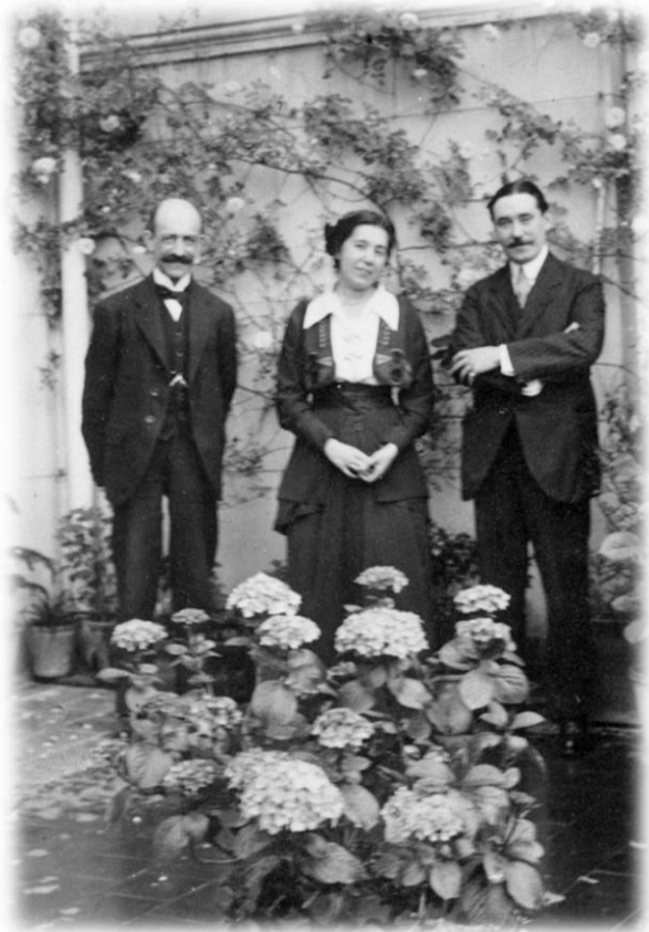
Manuel de Falla, María Lejárraga, Gregorio Martínez Sierra, Madrid 1916