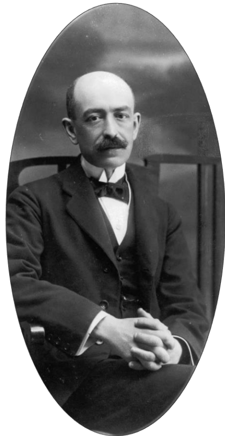
Manuel de Falla, 1915